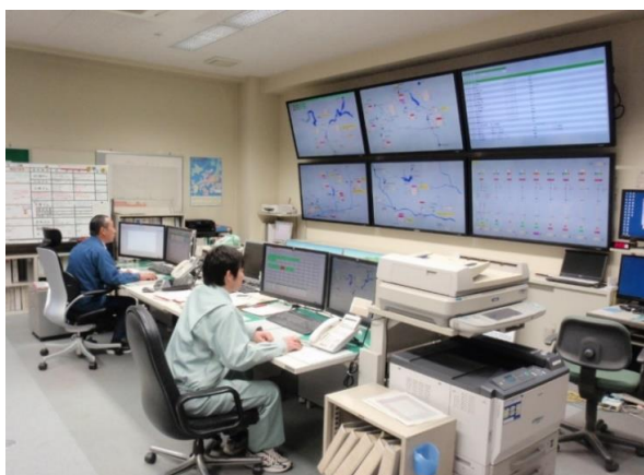
(今市発電管理事務所)